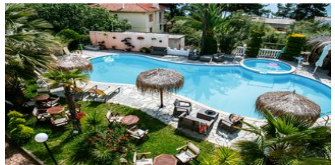
Blick auf den Poolbereich