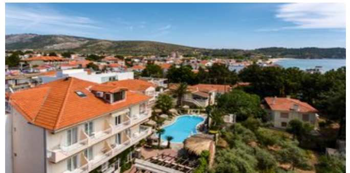
Blick auf das Hotel Potos