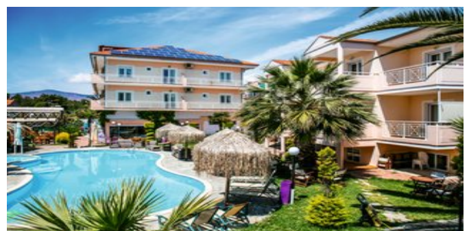
Das Hotel Potos