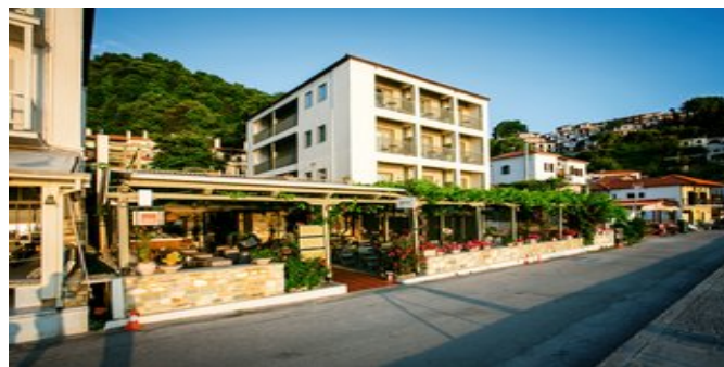
Das Kenta Beach Hotel

SPARTIPP Bei Buchung eines Attika Mietwagens Transfergutschrift ab/bis Thessaloníki EUR 362, ab/bis Vólos EUR 146 pro Person. Einen Mietwagen der Kat. A1 erhalten Sie schon ab EUR 140 pro Woche.