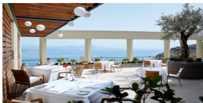
Im Gourmetrestaurant "Five Senses"