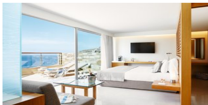
Wohnbeispiel Deluxe Zimmer