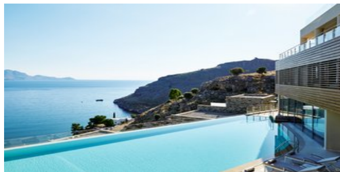
Blick über den Pool und die Anlage

ATTIKA SERVICE Deutschsprachige Reiseleitung. Taxi-Transfer bei Pauschalreise inklusive.