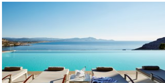
An einem der Pools

JUNIORSUITEN (UA) Ca. 38 qm. Einrichtung und Grundausstattung wie die Zimmer, zusätzlich mit Sitzecke. Jacuzzi-Bad und Dusche/WC, Föhn. Großer Balkon oder Terrasse mit Meerblick.