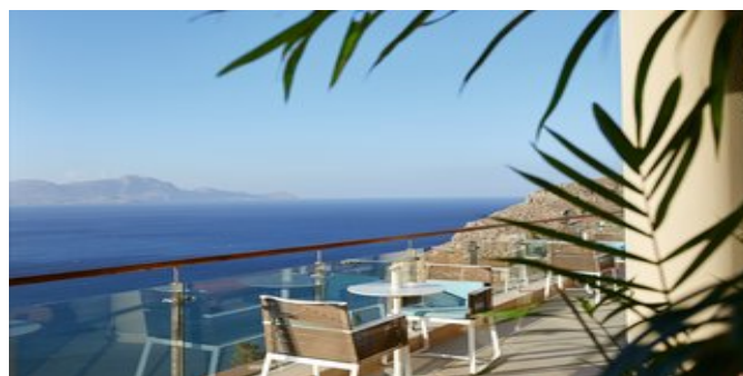
Auf der Terrasse