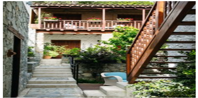
Im Casale Panayiotis

WELLNESS Neu errichtetes, exklusives "Myrianthousa"-Spa (ab 16 Jahren) mit Sauna, Dampfbad, kleinem Hydrotherapiepool und Eisgrotte sowie einer Vielzahl an luxuriösen Anwendungen, speziellen Thermal- und Schwefelwasserbehandlungen, Wellness- und Hydrotherapien (jeweils gegen Gebühr). Alle Spa-Produkte bestehen aus lokalen Kräutern, Pflanzen und Ölen.