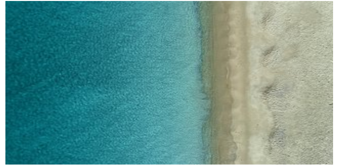
Blick auf den Strand