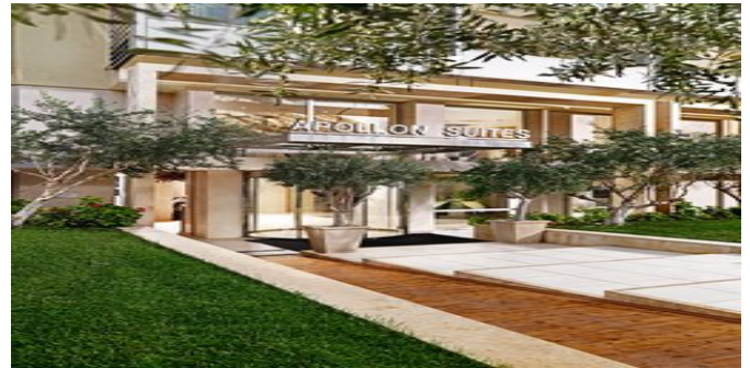
Die Divani Apollon Suites