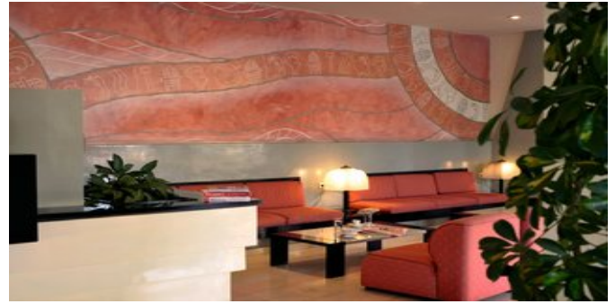
In der Lobby