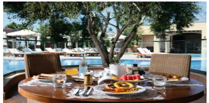
Das "Elia" Restaurant im Varos Village Boutique Hotel