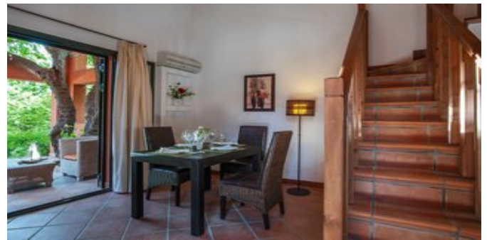
Wohnbeispiel Village Suiten