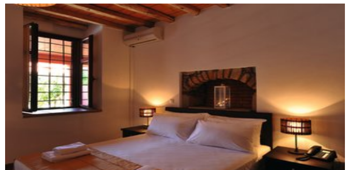
Wohnbeispiel Village Superiorzimmer