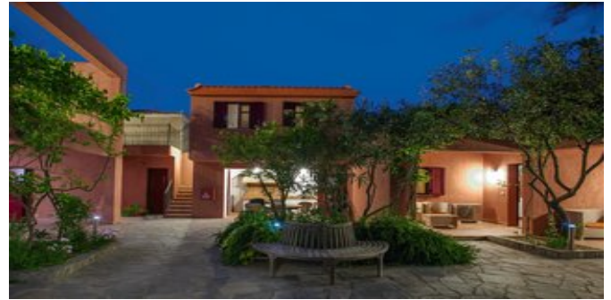
Das Hotel The Varos Residences

VILLAGE SUITEN (UD) Ca. 95 qm. Für 2-4 Erwachsene und 1 Kind. In warmen mediterranen Farbtönen eingerichtet, mit Holzdecken. Grundausstattung wie die Village-Superiorzimmer, auf 2 Ebenen angelegt. Im Erdgeschoss großzügiger Wohnbereich mit 2 Sofabetten,