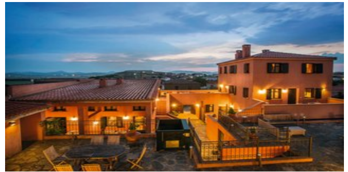
Abendstimmung in der Anlage