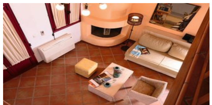
Wohnbeispiel Village Suiten