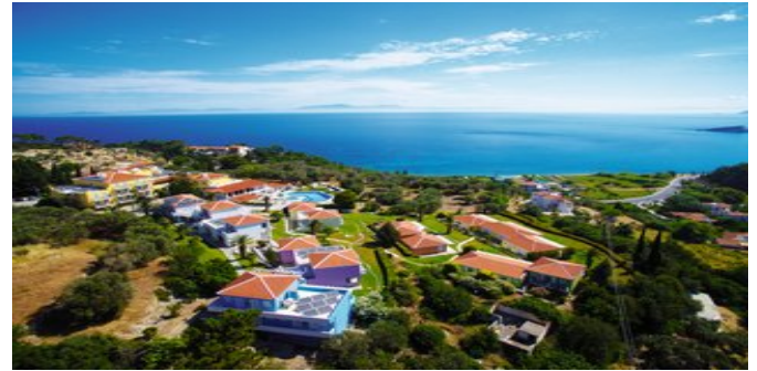
Blick auf das Hotel Arion

VERPFLEGUNG ÜF, HP (reichhaltiges Frühstücksbuffet und Abendbuffet mit griechischen und internationalen Spezialitäten). 3-mal pro Woche Themenabende.