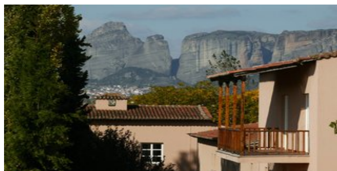
Hotel Amalia / wunderbare Aussichten auf die Meteora-Felsen