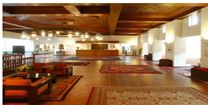
In der Empfangshalle