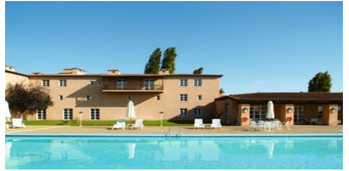
Das Hotel Amalia Kalambaka