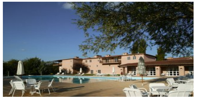
Das Hotel Amalia Kalambaka