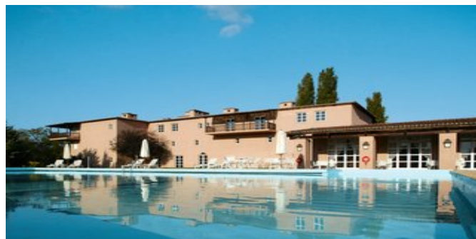
Das Hotel Amalia Kalambaka mit Pool

Website: www.attika.de E-Mail: verkauf@attika.de