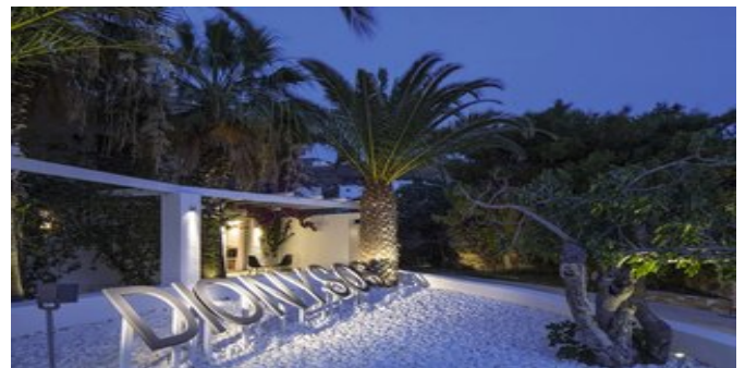
Das Hotel Dionysos