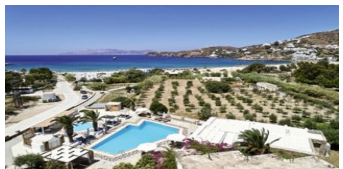
Blick auf die Anlage