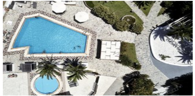
Blick auf den Poolbereich