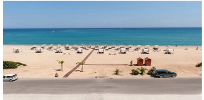
Der Strand beim Hotel

WELLNESS Gegen Gebühr: Spa und Wellnesscenter mit einem umfangreichen Angebot an Schönheitsbehandlungen und Massagen.