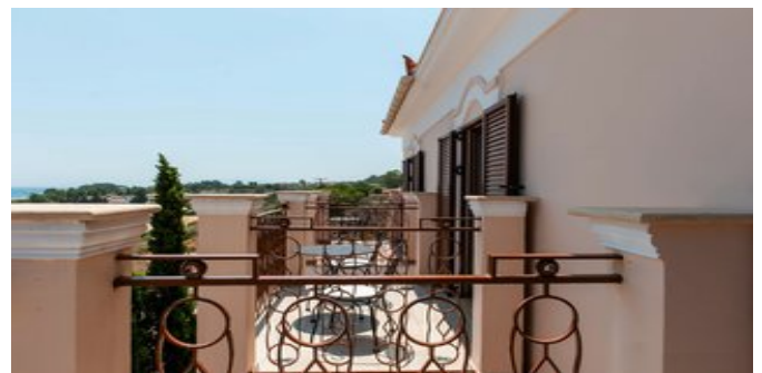
Auf dem Balkon