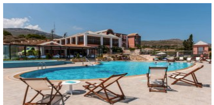
Die Anlage mit Pool