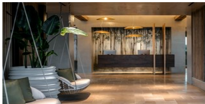
Innenbereich des Hotels