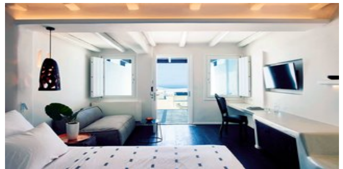
Wohnbeispiel Suite mit Jacuzzi