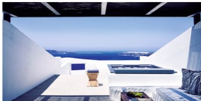
Wohnbeispiel Suite mit Jacuzzi

SPARTIPP Bei Buchung eines Attika Mietwagens ab/bis Flughafen Transfergutschrift EUR 38 pro Person. Einen Mietwagen der Kat. A1 erhalten Sie schon ab EUR 140 pro Woche.