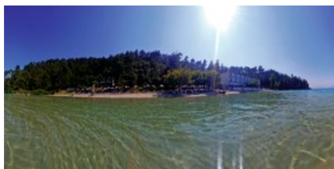
Das Hotel Glyfada