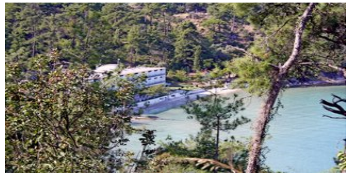
Blick auf das Hotel Glyfada