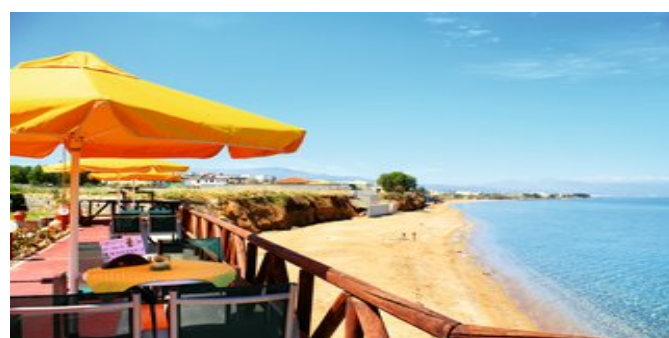
Blick von der Anlage