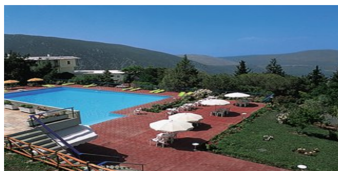
Hotel Amalia Delphi