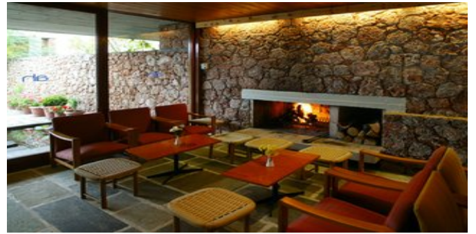
Im Aufenthaltsbereich der Bar