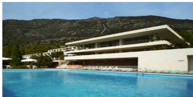
Das Hotel Amalia Delphi mit Pool

Website: www.attika.de E-Mail: verkauf@attika.de