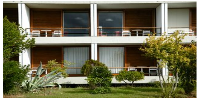
Das Hotel Amalia Delphi