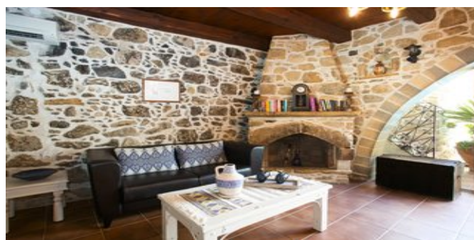
Villa Epimenidis - der Wohnraum