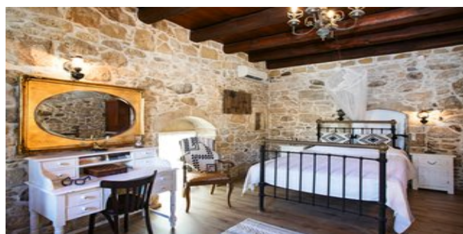
Wohnbeispiel Villa Epimenidis