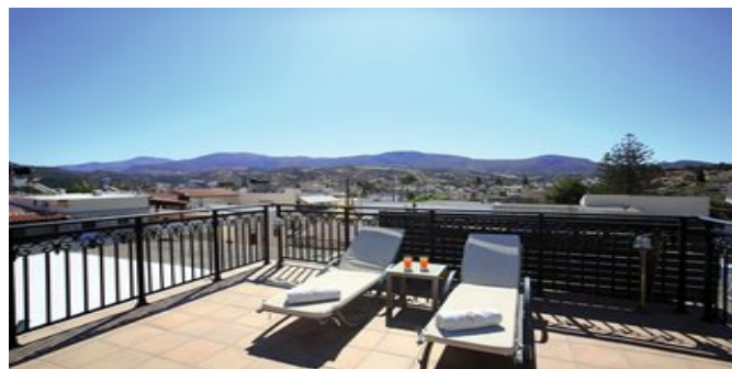
Villa Epimenidis - auf der Terrasse