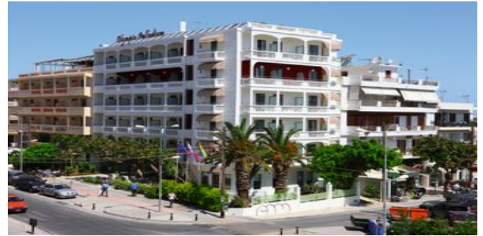
Das Hotel Olympic Palladium

SPARTIPP Bei Buchung eines Attika Mietwagens Transfergutschrift ab/bis Chaniá EUR 114, ab/bis Heráklion EUR 96 pro Person. Einen Mietwagen der Kat. A1 erhalten Sie schon ab EUR 140 pro Woche.