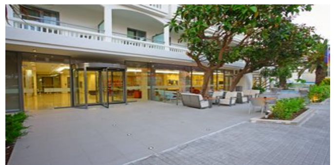
Das Hotel Olympic Palladium