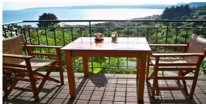
Blick auf das Meer

SPARTIPP Bei Buchung eines Attika Mietwagens Transfergutschein ab/bis Flughafen EUR 60, ab/bis Hafen bis zu EUR 86 pro Person. Einen Mietwagen der Kat. A1 erhalten Sie schon ab EUR 140 pro Woche.