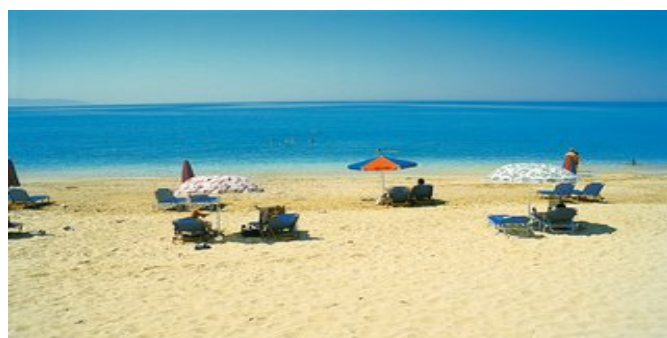
Der Strand bei den Studios