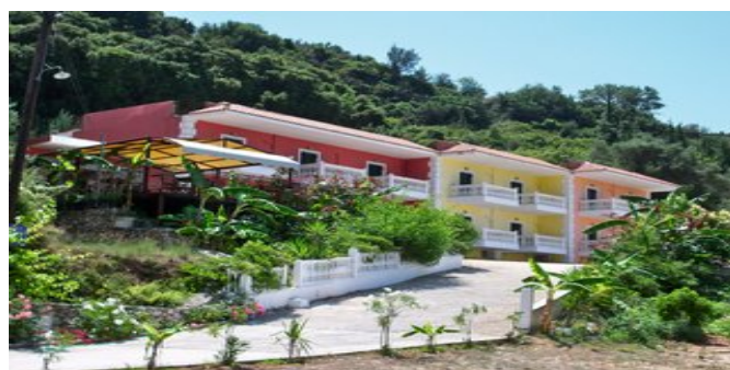
Die Aghios Gerasimos Studios