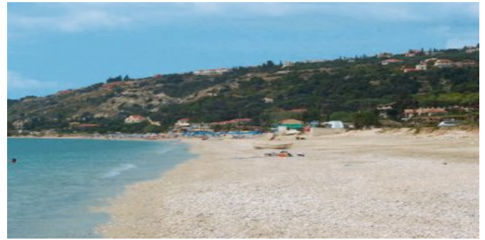
Der Strand bei den Studios