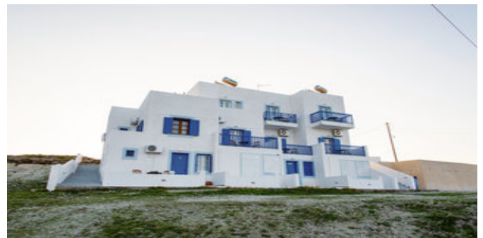
Das Polyegos View