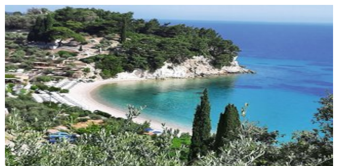
Blick auf den Strand