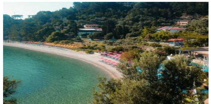
Die Appartements Marina rechts oben