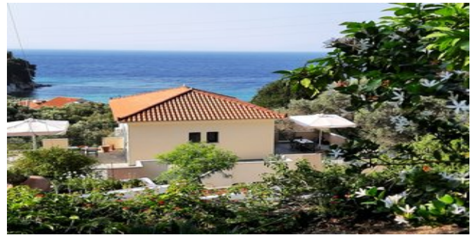
Blick auf die Anlage