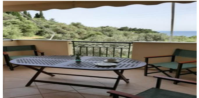
Auf dem Balkon