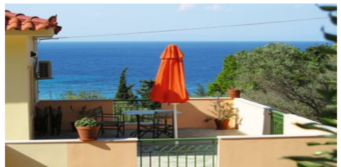
Auf dem Balkon