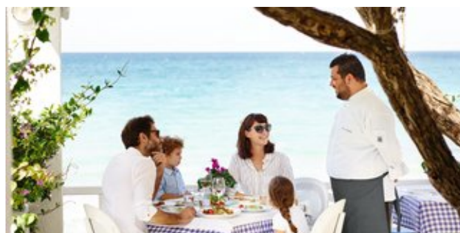
In der Ouzerie