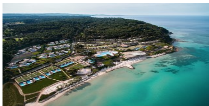
Blick auf die Anlage