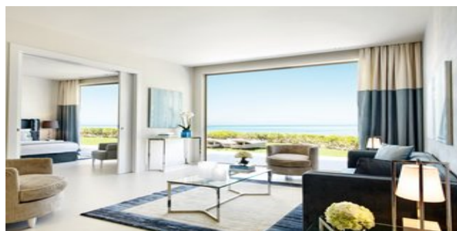
Wohnbeispiel One Bedroom Bungalowsuiten mit privatem Garten