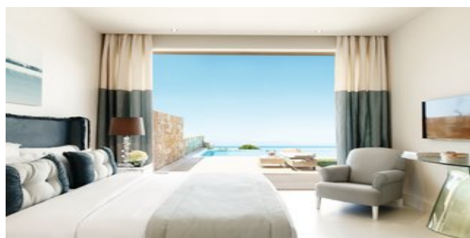
Wohnbeispiel One Bedroom Bungalowsuiten mit privatem