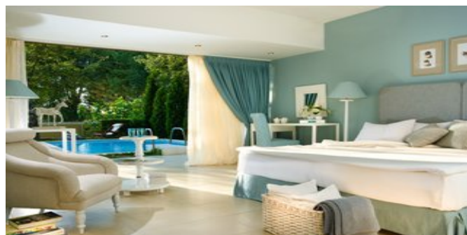
Wohnbeispiel Juniorsuite mit privatem Pool