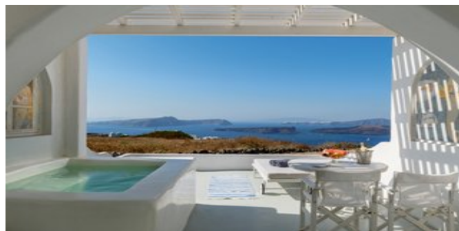
Wohnbeispiel Deluxe Suiten Outdoor Jacuzzi

FAMILY ELEGANT MAISONETTEN PLUNGE POOL (UH) Ca. 48 qm. Für 2-4 Personen. Grundausrüstung wie die Comfort Suiten. Kombiniertes Wohn-/Schlafraum mit Sofabett, 1 separater Schlafraum mit Kingsize-Bett und 1