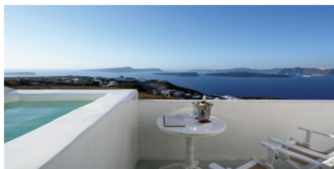
Terrasse mit Jacuzzi und Meerblick