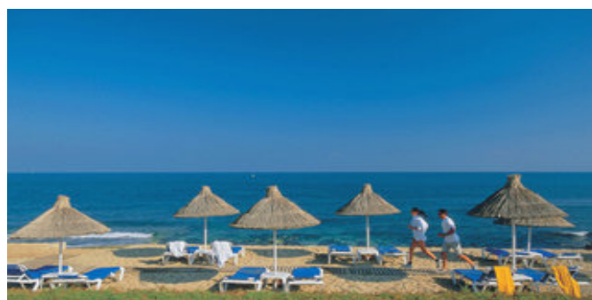
Der Strand beim Hotel