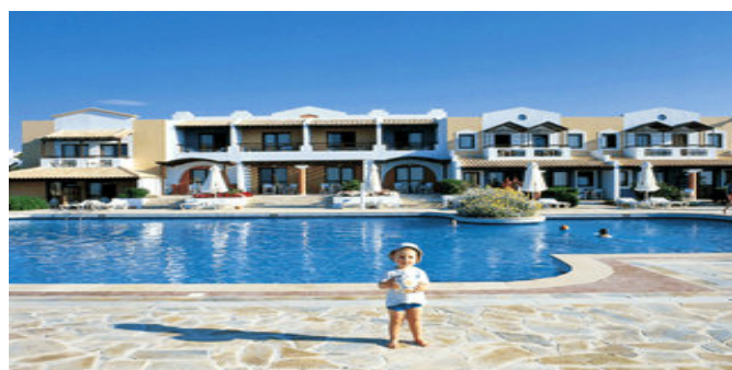
Ein Teil der Anlage mit Pool