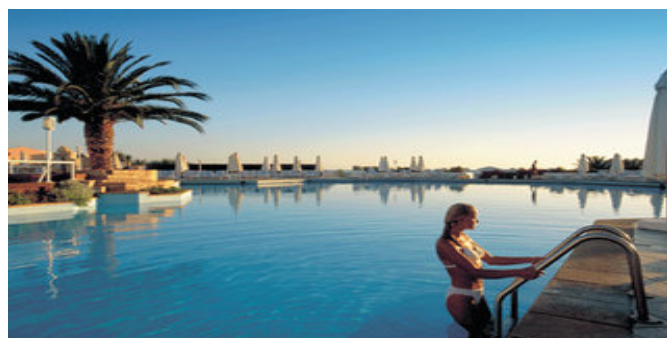
Einer der Pools