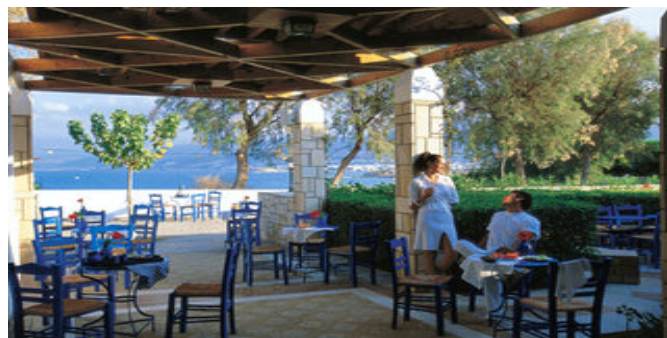
In der Taverne

AI="BEINHALTET zusätzlich kontinentales Frühaufsteher-Frühstück nach Anmeldung von 7.00-7.30 Uhr, kontinentales Langschläfer-Frühstück in der Snack Bar 10.00-11.15 Uhr. Mittagessen: 12.30-15.30 Uhr in der Snack Bar, Kinder-Restaurant "Aldy" für Abendessen. Zusätzlich 1-mal pro Aufenthalt (ab 4 Nächten): Mittagsbuffet in der Strand-Snackbar (Reservierung erforderlich) und Abendessen als griechisches Menü in der Taverne "Artemis" und im Gourmet Restaurant "Fontana Amorosa" (jeweils Reservierung erforderlich) 19.00-22.00 Uhr inklusive lokalem Wein, Bier, Softdrinks, Kaffee, Tee). Snack-Buffet (kalte und warme Snacks und Eis) 15.30-16.30 Uhr sowie Kaffee und Kuchen von 11.15-12.30 Uhr und 16.30-17.30 Uhr. Softdrinks, Hauswein, Bier, Wasser während der Mahlzeiten. Nationale und internationale alkoholische Getränke (laut Karte), Softdrinks,