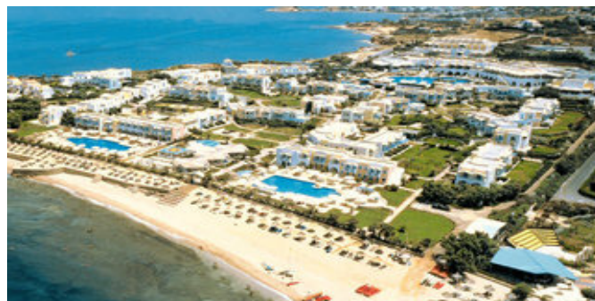
Aldemar Knossos Royal Village

FAMILIENZIMMER (FA) Ca. 39 qm. Für 2 Erwachsene und 1 Kind oder 2 Erwachsene und 2 Kinder. Grundausrüstung wie die Bungalowzimmer. Wohn-/Schlafzimmer mit Extrabetten für die Kinder, Kühlschrank, 1 separater Schlafraum. Bad/WC, Föhn, mit Zugang von beiden Räumen, Slipper. Balkon oder