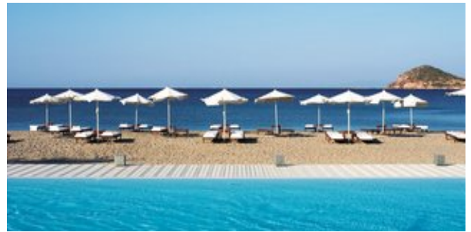
Der Pool mit Strand

EXCLUSIVE FAMILIENZIMMER (RD) Ca. 40 qm. Für 2-3 Erwachsene und 1 Kind. Grundausstattung wie die Comfortzimmer, mit größerer Sitzecke, mit Sofabett und Zustellbett für die 3. und 4. Person. Bad/WC, Föhn, Bademantel, Slipper. Großer Balkon mit atemberaubendem Meerblick.