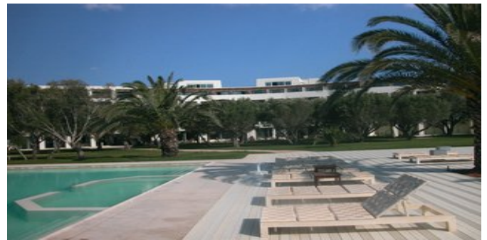
Die Anlage mit Pool