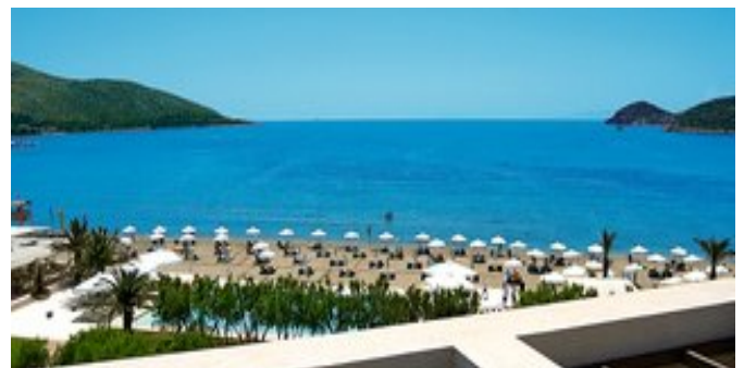
Blick auf den Strand