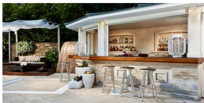
An der Poolbar