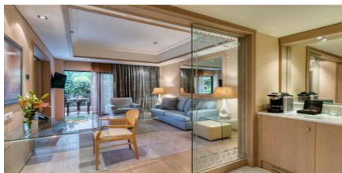
Wohnbeispiel Executive Suiten