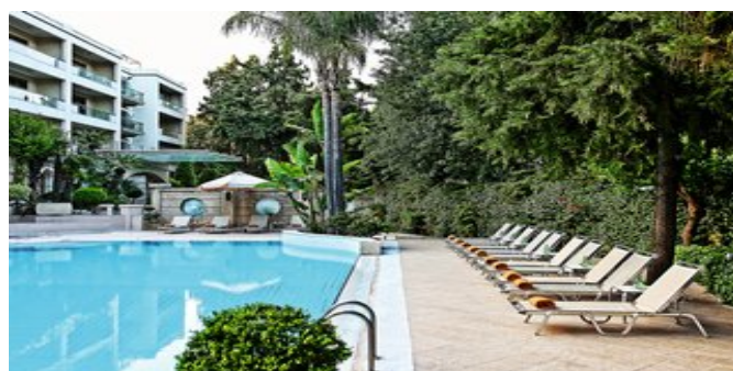
Das Hotel Rodos Park Suites & Spa