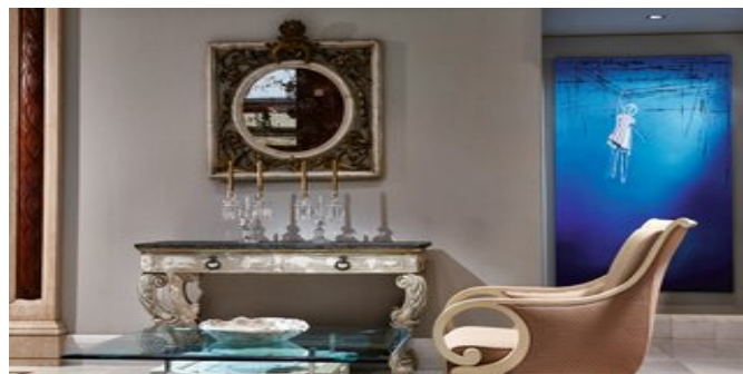
In der Lobby