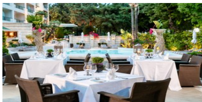
Restaurant "Il Parco"