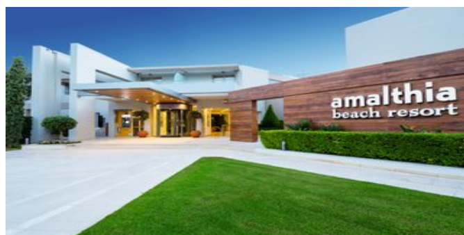
Atlantica Amalthia Beach Hotel