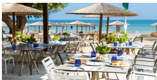
Im "Wave" Haupt- und À-la-carte-Restaurant