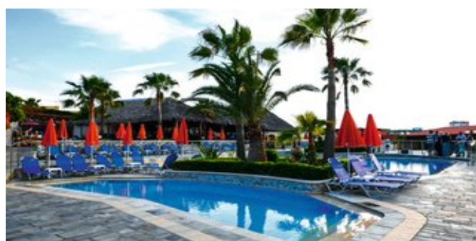
Poolbereich mit Sonnenterrasse