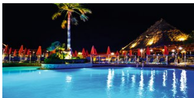
Pool bei Nacht