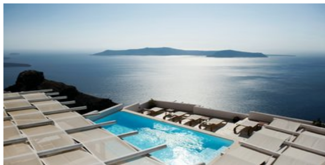
Blick auf den Pool

VERPFLEGUNG ÜF (Frühstück à-la-carte, das auf dem Zimmer serviert wird).