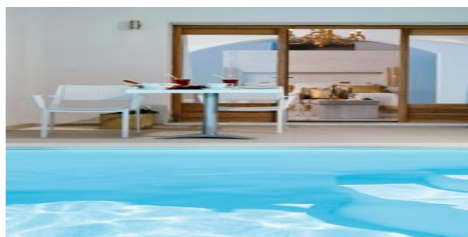
Deluxesuite mit Pool