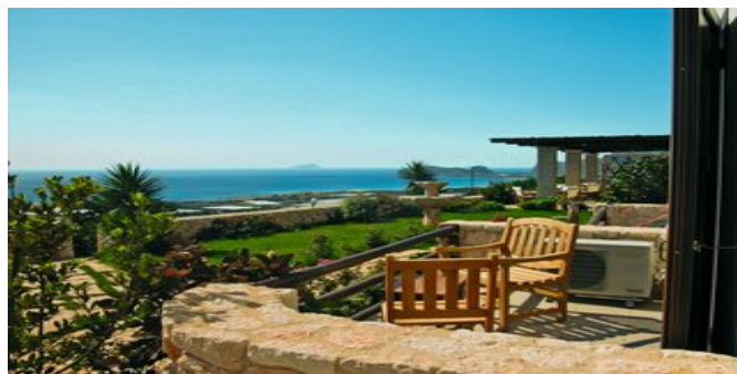
Balkon mit Blick auf die Küste

EXTRAS Der Besitzer veranstaltet mehrmals