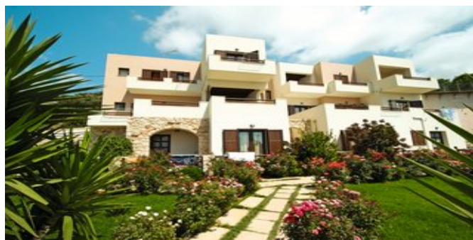
Die Apartments Kavoussi Resort