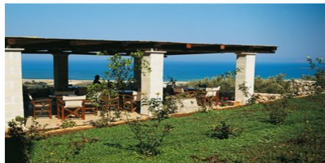
Terrasse mit Blick auf die Küste