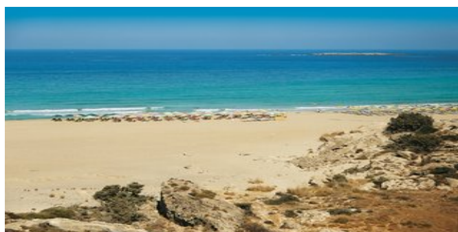
Der Strand von Falássarna