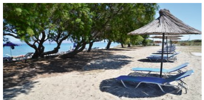
Am Strand beim Hotel