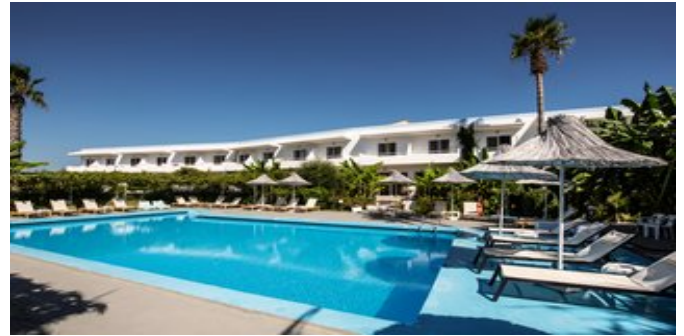
Die Anlage mit Pool