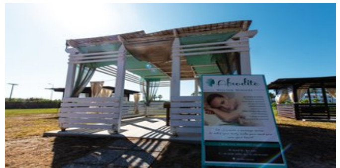
Sich verwöhnen lassen