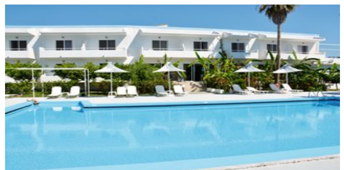
Die Anlage mit Pool