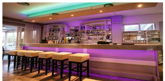
An der Bar