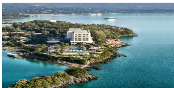
Blick auf das Grecotel Corfu Imperial Exclusive Resort