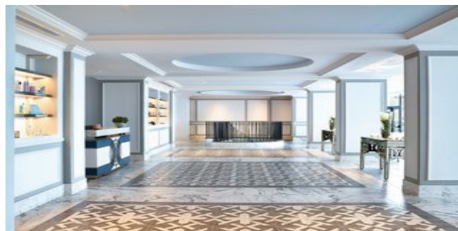
Im "Elixir Beauty Spa"- Bereich

DELUXE SUITEN MEERBLICK (UE) Ca. 64 qm. Für 2 Erwachsene und 1 Kind. Lage in der obersten Etage des Haupthauses. Grundausrüstung wie die Deluxe Zimmer. Wohnraum und ein, durch eine Schiebetür abtrennbares Schlafzimmer. 2 Badezimmer, eines mit Badewanne, eines mit Dusche/WC, Föhn, Pflegeprodukte, Bademantel, Slipper. Balkon mit Panorama-Meerblick.