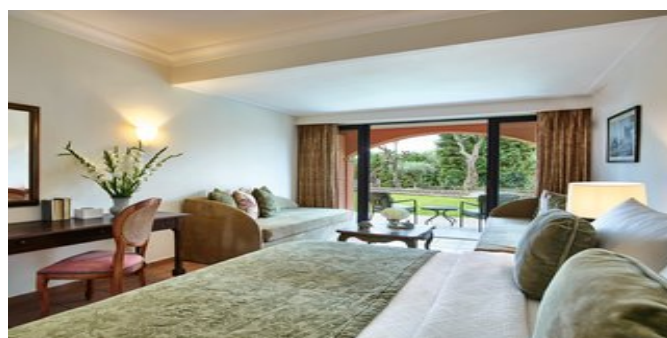
Wohnbeispiel Corfu Familybungalows Open Plan