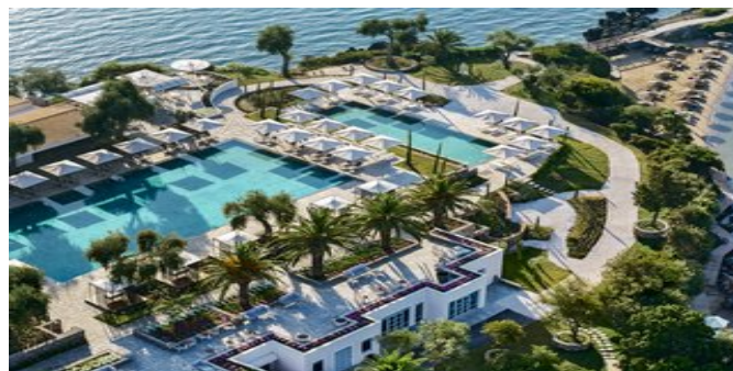
Das Grecotel Corfu Imperial Exclusive Resort