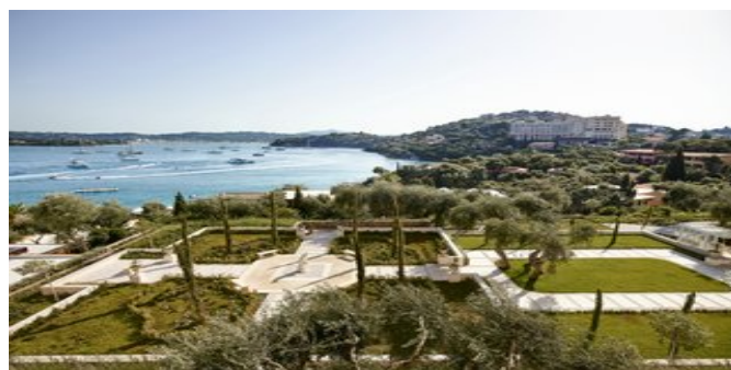
In der Anlage