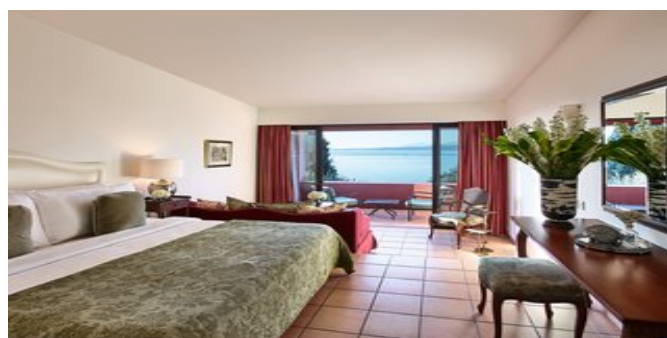
Wohnbeispiel Corfu Bungalows Open Plan