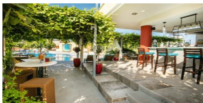
An der Poolbar