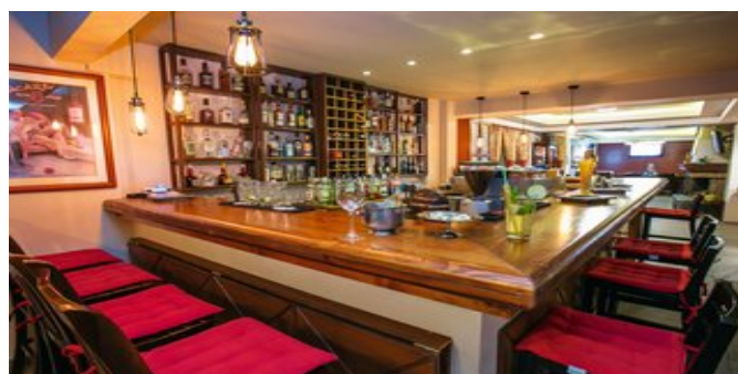
An der Bar