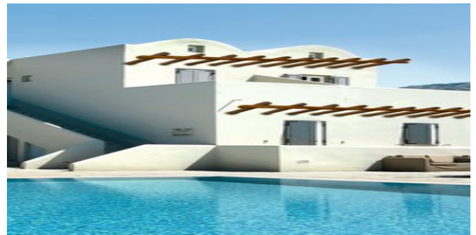
Das Thera Mare Hotel mit Pool