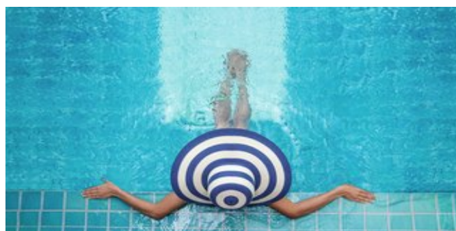
Entspannung am Pool