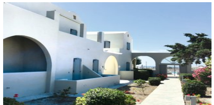
Das Thera Mare Hotel