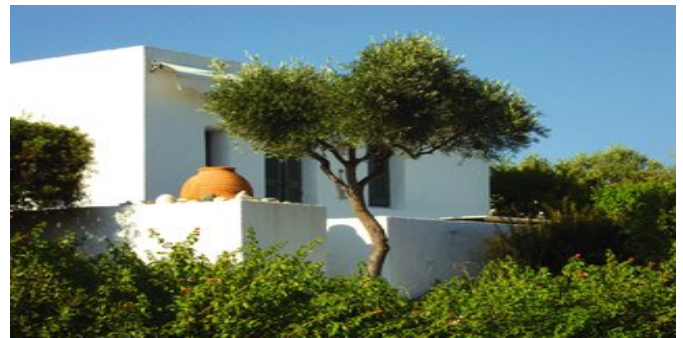
Eines der Apartments