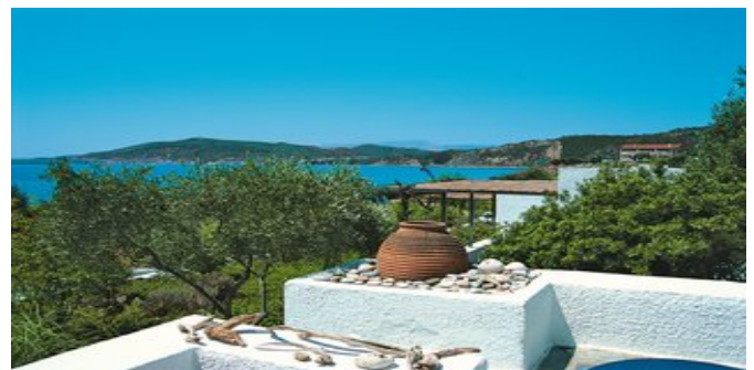
Blick von der Anlage