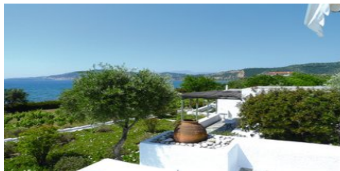
Blick von der Anlage

EXTRAS Zur Begrüßung Willkommenskorb mit biologischen Produkten aus der Region. Drei