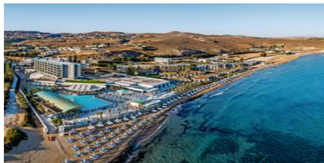
Blick auf die Anlage und das Meer

ZIMMER RUN OF THE HOUSE (SS) Ca. 28-32 qm. Grundausstattung wie die Annex Zimmer. Dusche/WC, Föhn, Pflegeprodukte. Balkon oder Terrasse mit Meerblick. Die Unterbringung kann in verschiedenen Zimmertypen erfolgen, nur als Einzelzimmer buchbar.