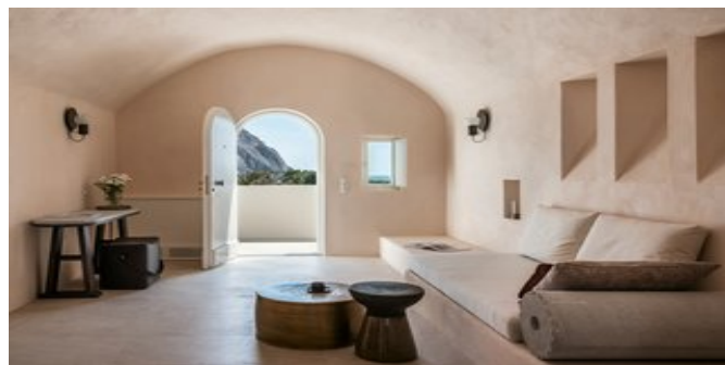
Wohnbeispiel Storia Suiten