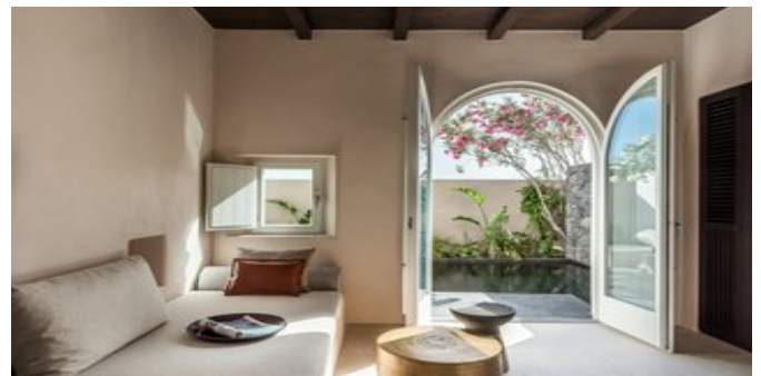
Wohnbeispiel Tarina Suiten