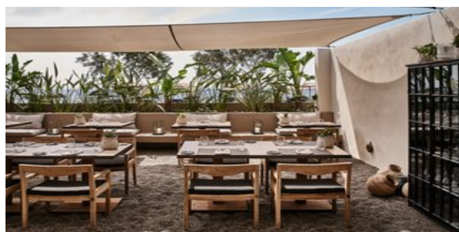
Das "Mr. E" Restaurant