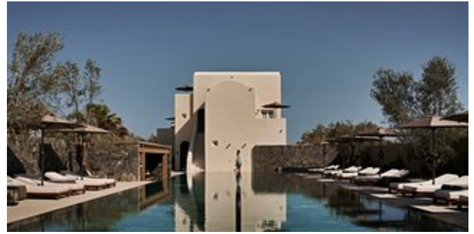
Der Infinity Pool

HOTELCHARAKTER Das Hotel ist Mitglied der [Design Hotels].