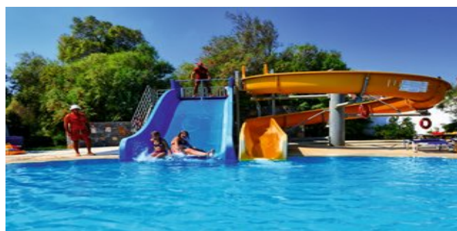
Poolbereich mit Wasserrutschen