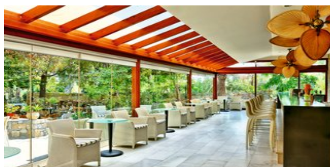
Restaurant und Bar