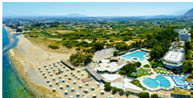
Außenansicht des Apollonia Beach Resort

FAMILIEN ZIMMER (RC) Ca. 50 qm. Für 2-3 Erwachsenen oder 2 Erwachsenen und 2 Kinder. Grundausstattung wie die Zimmer. Wohn-/Schlafraum mit Schlafcouch, 1 separates Schlafzimmer. Bad und Dusche/WC, Föhn, Badeartikel und Strandtücher. Balkon oder Terrasse mit Gartenblick.