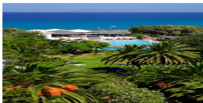
Gartenanlage mit Pool