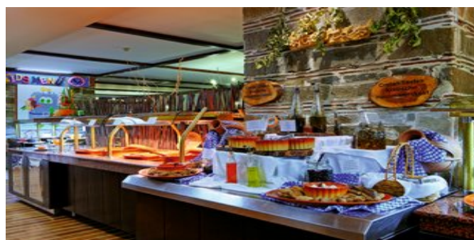
Restaurant mit Buffet