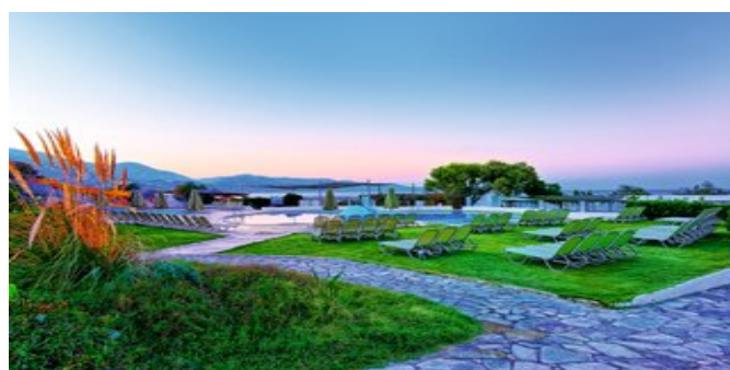
Gartenanlage mit Pool