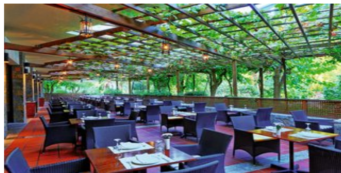
Restaurant mit Terrasse