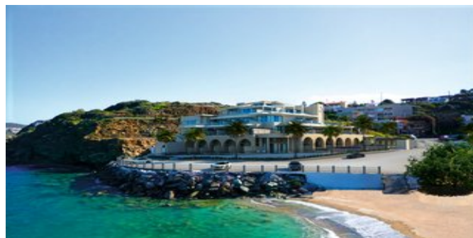
Außenansicht des Hotels

HINWEIS Adults only ☐ das Hotel ist für Gäste ab 16 Jahren buchbar.