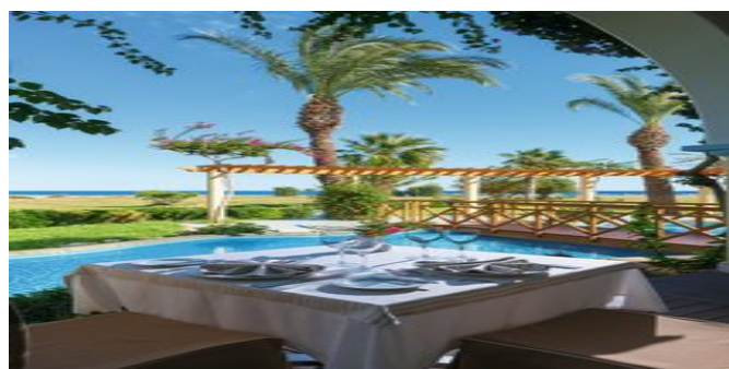
Im "Asterias" á-la-carte Restaurant