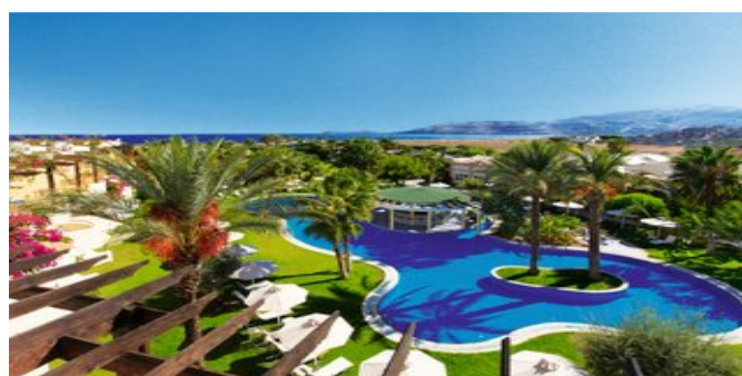
Blick über den Poolbereich