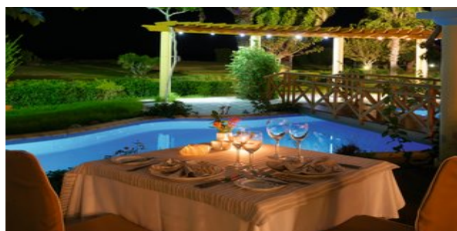
Im "Asterias" á-la-carte Restaurant