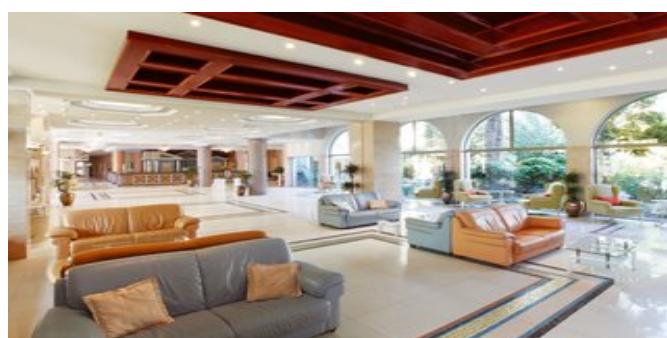
In der Lobby