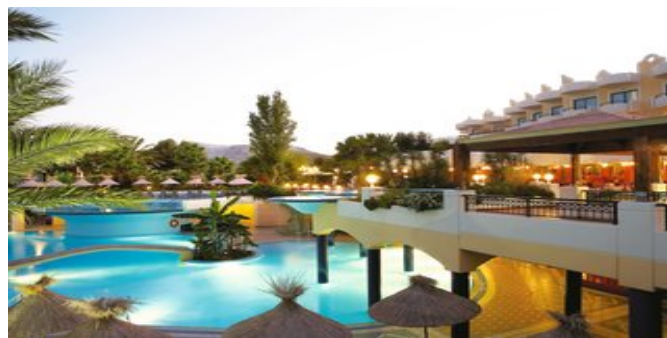
Das Hotel Atrium Palace Thalasso Spa Resort

FAMILIENSUITEN (FA) Ca. 40 qm. Für 2-4 Personen. Grundausrüstung wie die Zimmer, jedoch mit Wohn-/Schlafbereich und separatem Schlafraum. Bad/WC mit Jacuzzi, Föhn, Bademantel, Slipper. Balkon oder Terrasse mit seitlichem Meerblick.