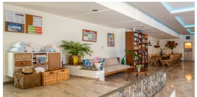
In der Lobby