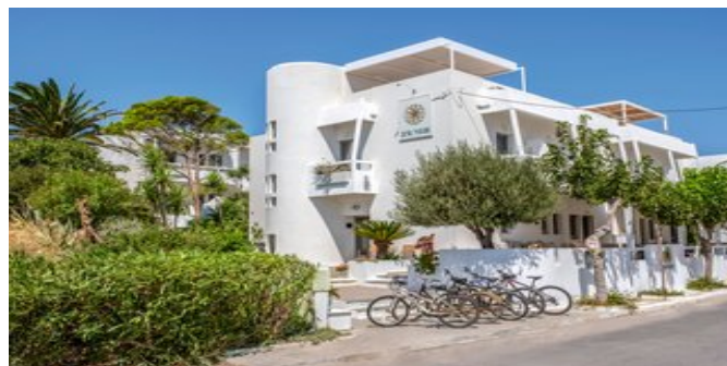
Das Hotel Aris

HOTELCHARAKTER Sehr beliebtes, familiär geführtes Haus mit herzlicher Atmosphäre und vielen Stammgästen. Das Hotel ist Mitglied der Initiative "Greek Breakfast".