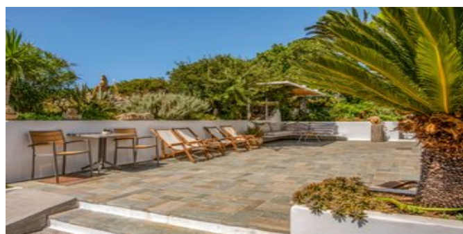
In der Anlage