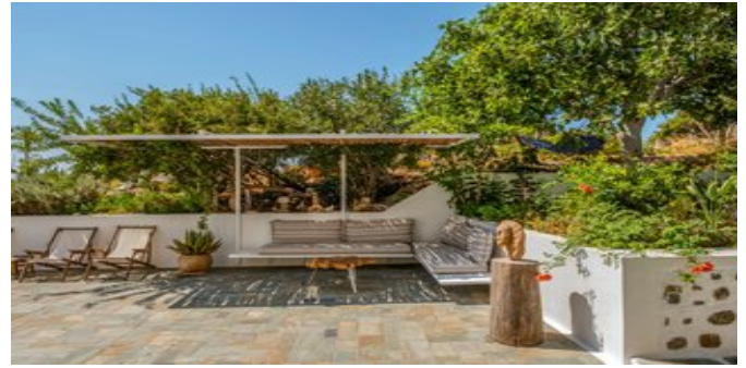
In der Anlage