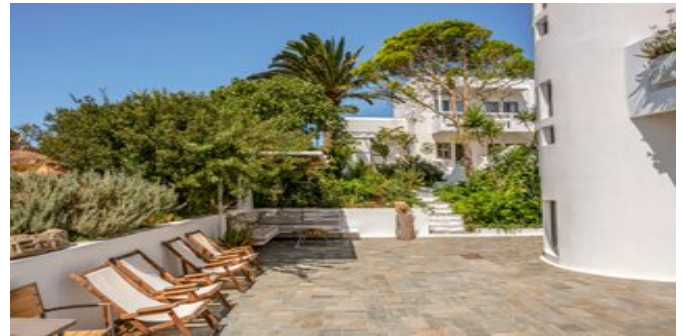
In der Anlage