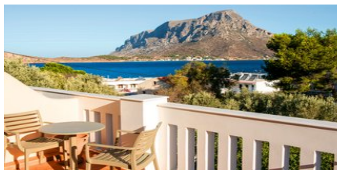
Ausblick auf das Meer