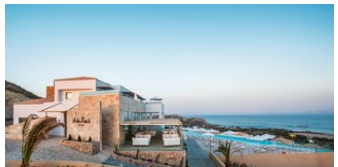
White Rock of Kos