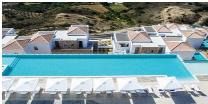
Blick auf den Pool und die Anlage