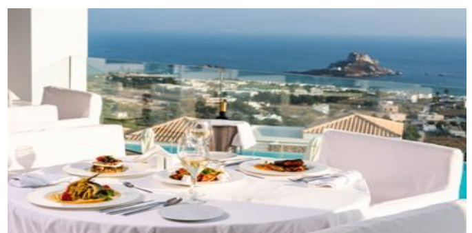
Genießen mit schöner Aussicht