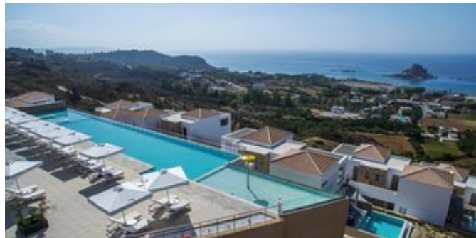
Blick vom White Rock of Kos