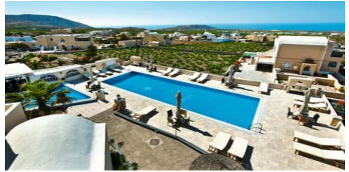
Blick über die Anlage