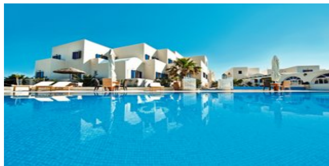
Das Hotel Star