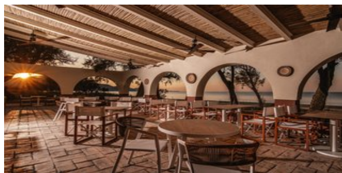
Caretta Beach Restaurant