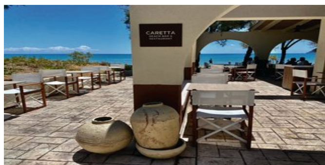
Caretta Beach Restaurant