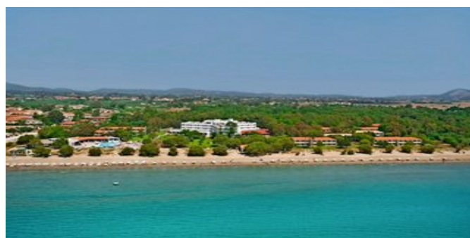
Blick auf die Anlage