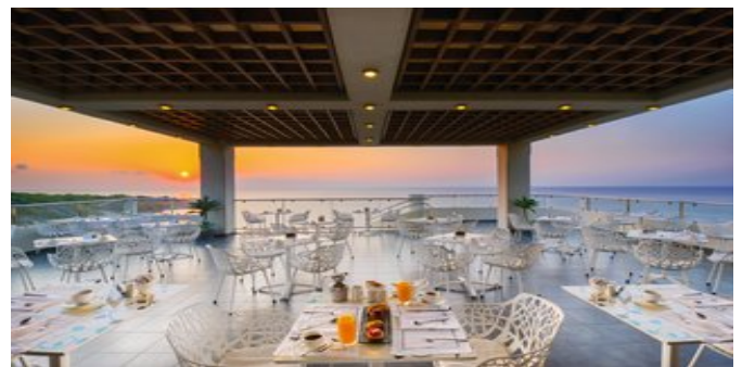
Der Cafe Club