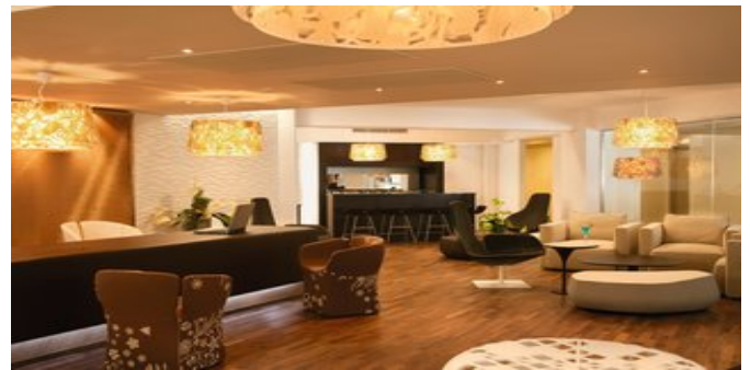
Der Cafe Club