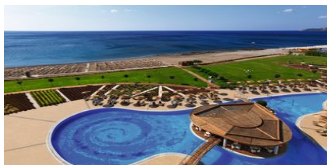
Der Strand vor der Anlage