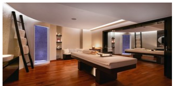
In der Spa