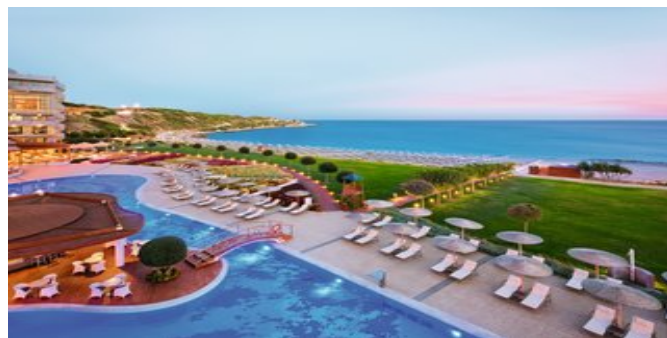
Blick auf das Meer

ELITE CLUB SUPERIOR ZIMMER (RE) Ca. 36 qm. Elite Club Service inkludiert. Grundausstattung wie die Deluxe Zimmer, mit