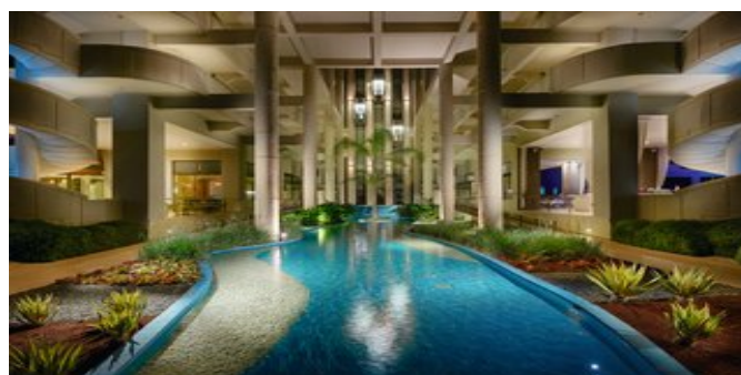
Der Garten im Atrium