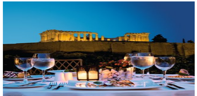
Blick von der Terrasse