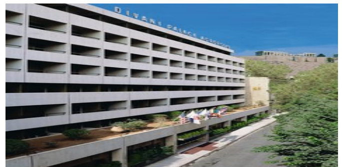
Das Hotel Divani Palace Acropolis