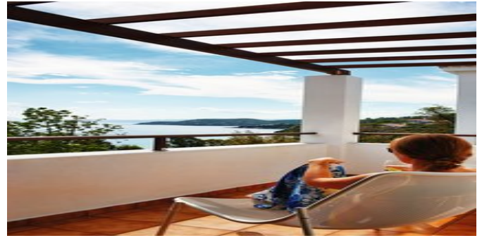
Auf dem Balkon einer der Deluxe Suiten