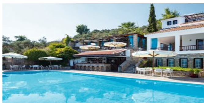
Das Hotel Aegean Suites