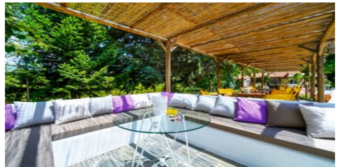
Gartenbereich mit Sitzzecke