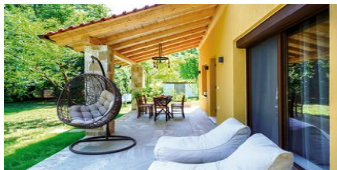
Terrasse mit Gartenanlage

JUNIORSUITEN (UA) Ca. 45 qm. Für 2-3 Erwachsene und 1 Kind. Neu renoviert. Grundausrüstung wie die Deluxe Studios, jedoch mit gehobener Ausstattung und einem weiteren Satelliten-TV. Ein Doppelbett und eine großes Schlafsofa mit orthopädischer Matratze für die 3.