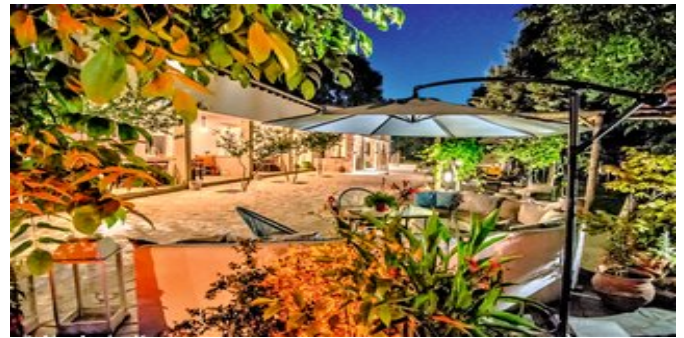
Gartenanlage mit Sitzzecke